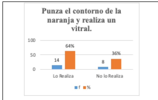
Figura 1. Habilidades aplicadas a los niños de 4 años del Colegio Manuel Cabrera Lozano